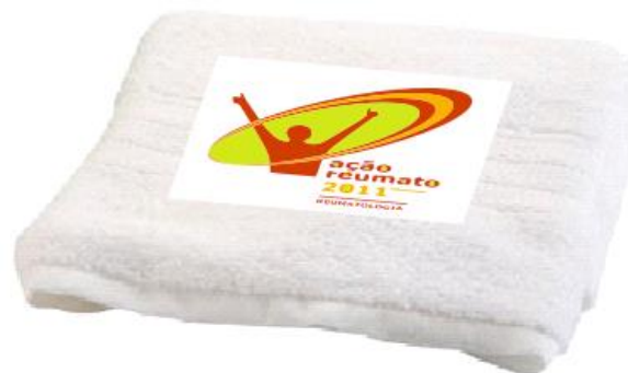
Toalha de rosto